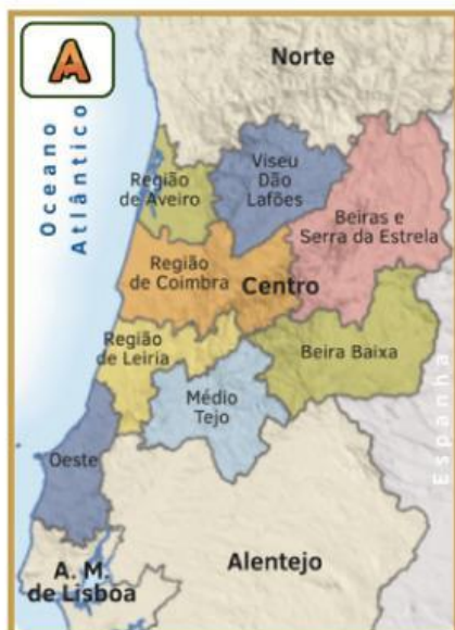
Nuts III da Região Centro de Portugal

Observa os mapas com diferentes escalas representados nas figuras A, B e C.