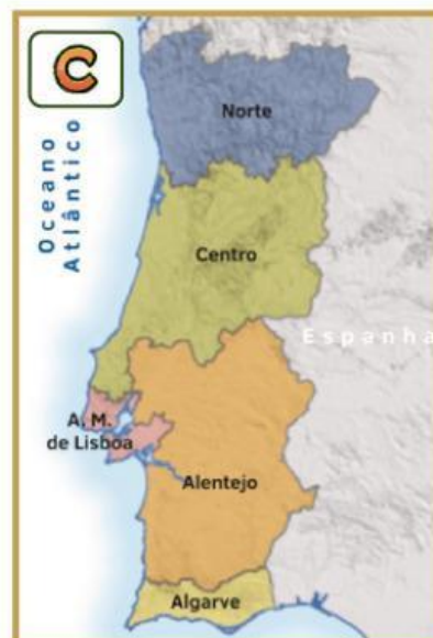
Nuts II de Portugal continental