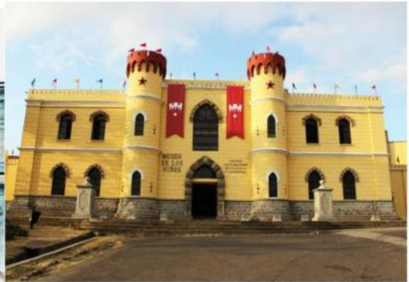
Museo de los Niños