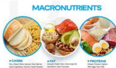
Gambar 1. Jenis zat makanan yang termasuk makronutrien

Jenis zat makanan yang dibutuhkan dalam jumlah besar untuk energi dan pertumbuhan seperti karbohidrat, protein, dan lemak. Berikut gambar makanan yang mengandung zat makanan tersebut dapat dilihat pada Gambar 1 .