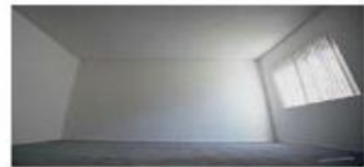
THE ROOM LA HABITACIÓN