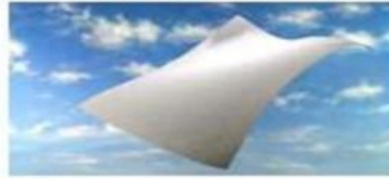
THE PAPER EL PAPEL