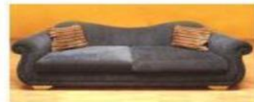
THE SOFA EL SOFÁ