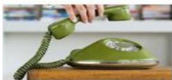
THE TELEPHONE EL TELÉFONO