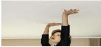
THE CEILING EL CIELO