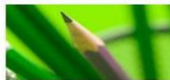
THE PENCIL EL LÁPIZ