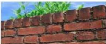
THE WALL LA PARED