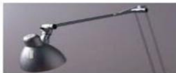
THE LAMP LA LÁMPARA