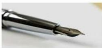
THE PEN LA LAPICERA