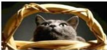
THE CAT EL GATO