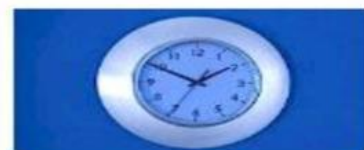
THE CLOCK EL RELOJ