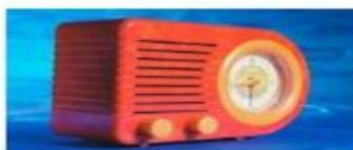
THE RADIO LA RADIO