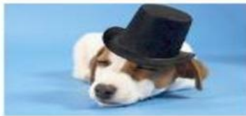
THE DOG EL PERRO