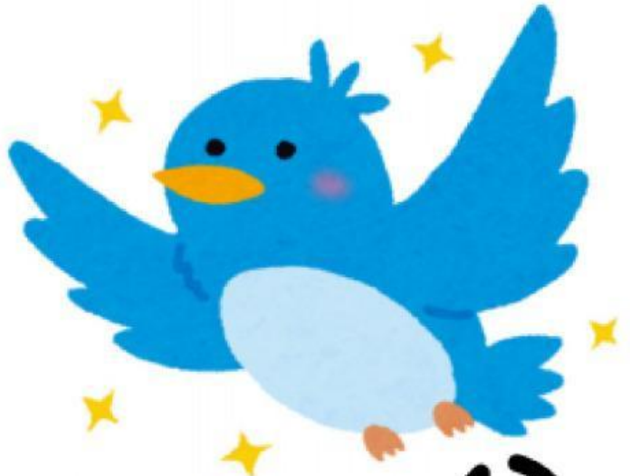
Bird (Con chim)