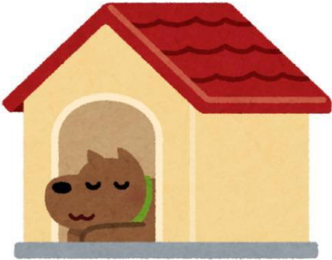
Doghouse (Nhà của chó)