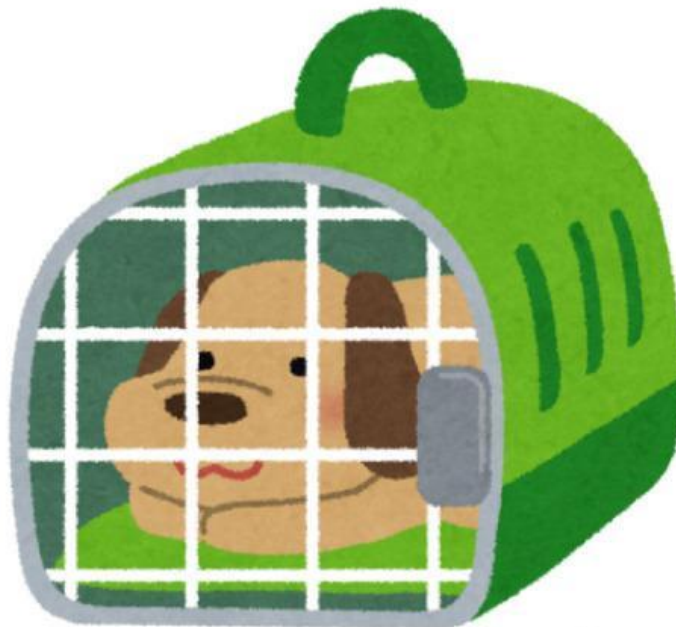
Cage (Cái lồng)