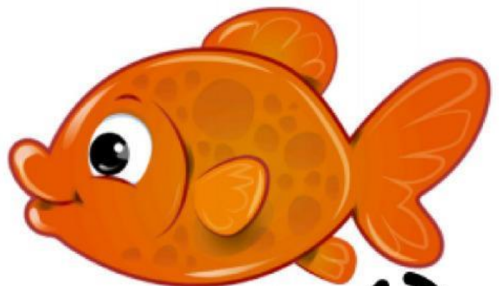
Fish (Con cá)