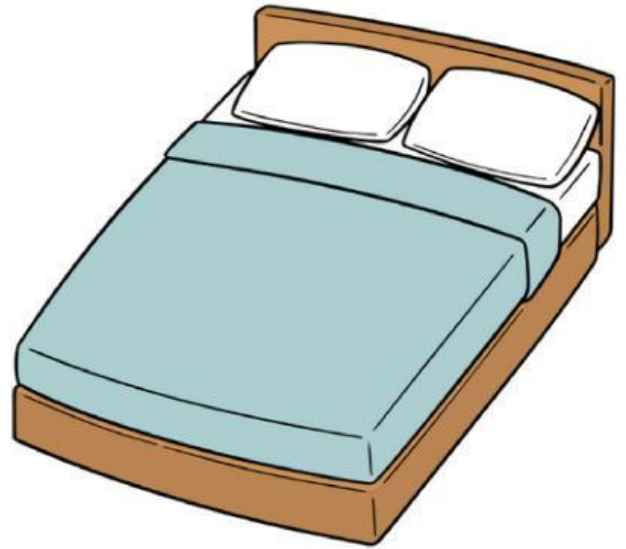
Bed (Cái giường)