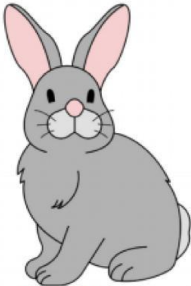
Rabbit (Con thỏ)