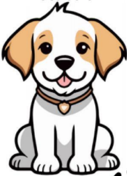
Dog (Con chó)