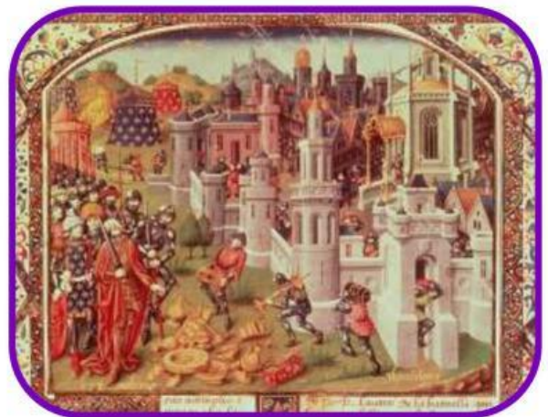
Conflicto entre cristianos europeos y combatientes árabes.

Las múltiples disputas por imponer las creencias religiosas influenciaron la toma de decisiones militares y alentaron la expansión y conquista de nuevos territorios, con el objetivo de lograr la conversión de pobladores de tierras lejanas a sus credos y culturas, considerados como universales y verdaderos. Un ejemplo de estos enfrentamientos son las cruzadas; campañas militares desarrolladas durante un periodo de casi 200 años, entre 1095 y 1291.