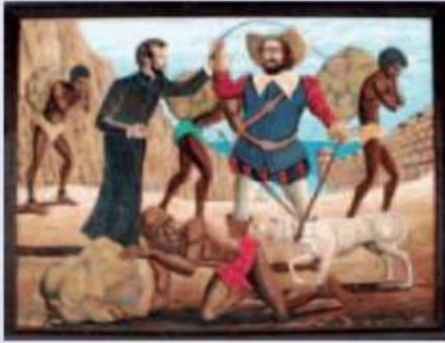
Fray Bartolomé de las Casas con grupo de indígenas.