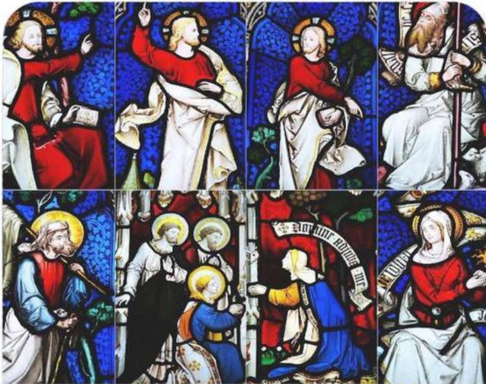
Imagen vitral etapas de la vida de Jesús.

territorio; otras se constituyeron en el vínculo entre pobladores originarios y colonizadores, quienes impusieron la religión cristiana.