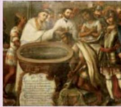
Evangelización de indígenas.