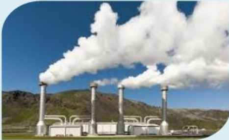
Gambar 3. PLTPB