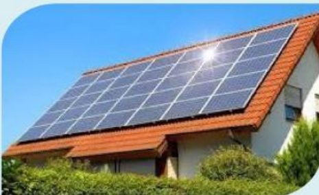
Gambar 1. PLTS