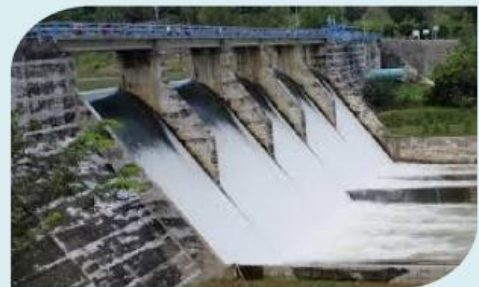
Gambar 4. PLTA