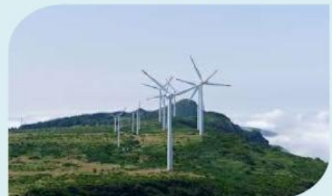
Gambar 2. PLTB