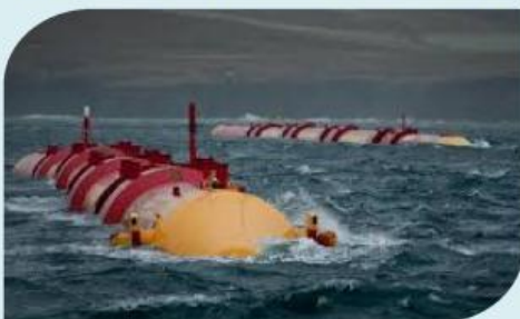
Gambar 5. PLTGL