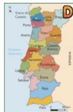
Mapa dos distritos de Portugal continental.