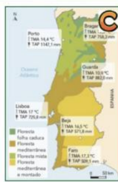
Principais formações vegetais e características térmicas e pluviométricas anuais em Portugal.