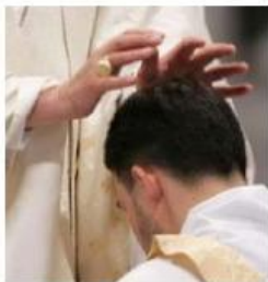
Imposición de manos