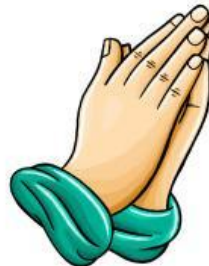
Oración del obispo

Recuerda: Reciben la misión de celebrar los sacramentos y guiar a la comunidad.