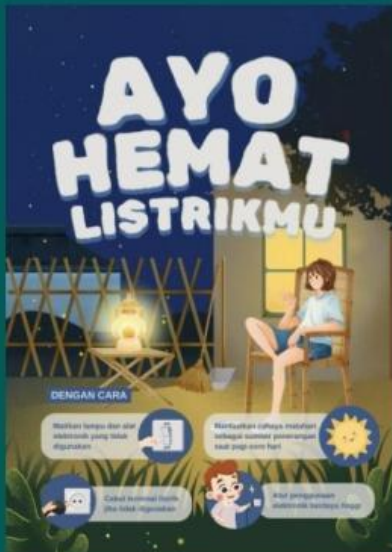
Ayo Hemat energi