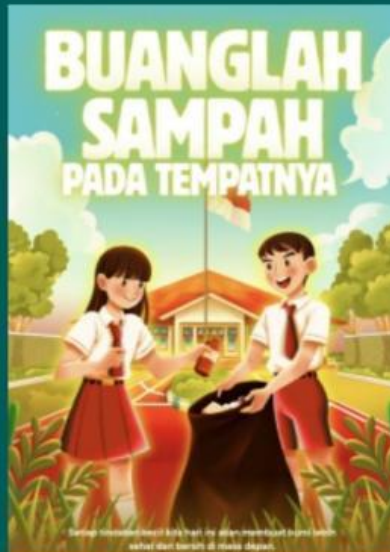
Buanglah sampah pada tempatnya