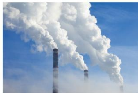
Gambar 2. Cerobong asap

Mengapa air ( \text{H}_2\text{O} ) bisa membentuk tetesan bulat, sedangkan karbon dioksida ( \text{CO}_2 ) berbentuk gas bebas? Menurut kalian, mengapa air bisa memiliki wujud berbeda-beda seperti itu? Apa hubungannya dengan susunan partikel atau molekulnya?"