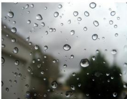
Gambar 1. Air hujan