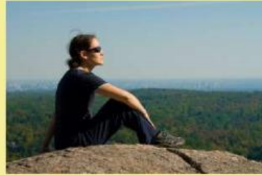
Gambar 1. Seseorang berjemur di bawah sinar matahari

Cobalah kalian menjemur diri di bawah sinar matahari pagi selama beberapa menit, lalu pegang lengan kalian sendiri atau bagian kulit yang terkena sinar matahari langsung. Apakah kalian merasakan hangat atau sedikit panas pada kulit tersebut?