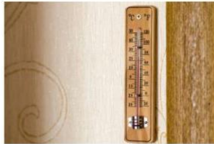
Gambar 7. Termometer Ruang

1. Ketika kamu melihat termometer ruang, kamu akan mendapati adanya dua skala yang berbeda. Menurut kamu kenapa terdapat 2 skala?