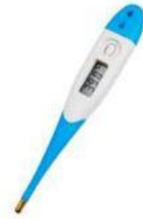
Gambar 2. Termometer suhu badan

Termometer yang digunakan untuk mengukur suhu tubuh hanya memiliki skala di sekitar 30^{\circ}\text{C} – 50^{\circ}\text{C} . Mengapa demikian? Penyebabnya adalah karena tidak ada manusia yang memiliki suhu tubuh di bawah 30^{\circ}\text{C} dan di atas 50^{\circ}\text{C} .