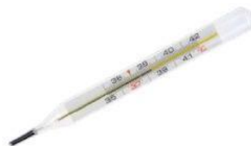
Gambar 8. Termometer air raksa

Pada keempat skala suhu yaitu Celcius, Fahrenheit, dan Kelvin memiliki perbedaan di bagian titik tetap bawah dan titik tetap atas pada skala termometer seperti yang ditunjukkan pada Gambar 8.