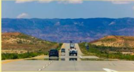
Gambar 3. Jalan aspal pada siang hari