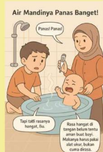
Gambar 2. Mandi air panas

Setelah kalian menjawab pertanyaan di atas, kalian pasti tahu betapa pentingnya alat ukur terutama alat ukur suhu. Alat ukur suhu bermacam-macam jenisnya. Perhatikan gambar gambar di bawah apakah kalian pernah melihat alat ini di rumah, sekolah, rumah sakit atau tempat lain? Tuliskan nama dan fungsi dari alat tersebut.