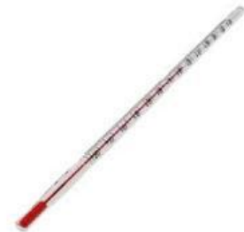
Gambar 3. Termometer Laboratorium

Termometer laboratorium memiliki bentuk yang panjang dengan skala dari -10^{\circ}\text{C} sampai 110^{\circ}\text{C} menggunakan raksa, atau alkohol seperti ditunjukkan pada Gambar 3. Termometer Laboratorium dapat digunakan untuk mengukur suhu dari es mencair sampai air mendidih.