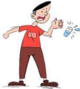
Gambar 1. Kepanasan memegang cangkir

Berdasarkan ilustrasi di atas, jawablah pertanyaan berikut: