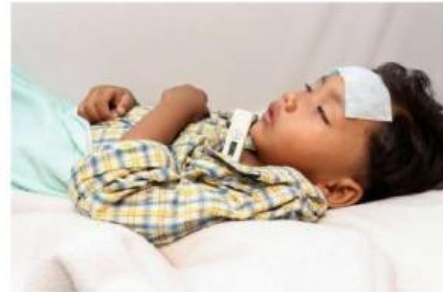
Gambar 7. Demam

Bayangkan kamu sedang memasak mie, atau bahkan saat kamu merasa demam. Kamu mungkin pernah berkata, "Air ini panas sekali!" atau "Badan saya terasa hangat." Tapi seberapa panas? Seberapa hangat?