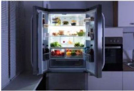
Gambar 4. Ibu menyimpan daging di dalam kulkas

Pada saat ibu membeli daging atau ikan yang begitu banyak. Daging atau ikan tersebut tidak akan habis dimasak dan dimakan oleh keluarga sampai dua hari. Kemudian daging atau ikan tersebut disimpan didalam kulkas agar awet. Adakah hubungannya dengan kalor?