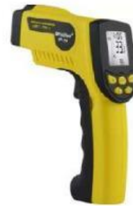
Gambar 6. Termometer Elektromagnetik

Termometer elektromagnetik adalah alat pengukur suhu yang memanfaatkan radiasi elektromagnetik, terutama radiasi inframerah. Termometer ini digunakan untuk pengukuran suhu benda yang sangat tinggi tanpa sentuhan langsung.