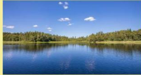
Gambar 4. Danau pada waktu siang hari