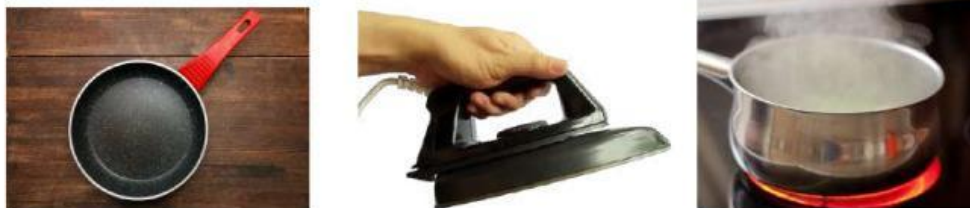
Gambar 5. Alat-alat yang menggunakan prinsip konduktor

Konduksi merupakan perpindahan panas melalui suatu bahan tanpa disertai dengan perpindahan partikel-partikel pada bahan tersebut. Benda yang jenisnya berbeda memiliki kemampuan menghantarkan panas secara konduksi (konduktivitas) yang berbeda pula.