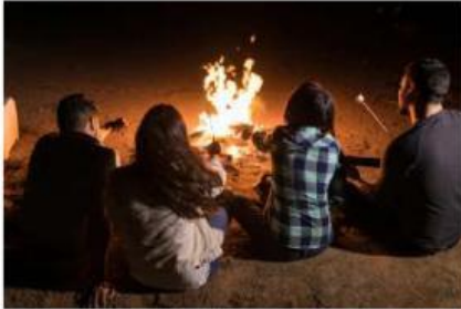
Gambar 4. Api Unggun

Malam di pegunungan benar-benar menusuk. Kalian dan teman-teman duduk mengelilingi api unggun sambil menikmati secangkir teh panas. Udara dingin menyelimuti, tapi kalian merasa cukup hangat karena dekat dengan api.