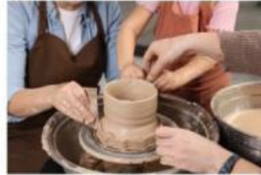
Membuat kerajinan tangan