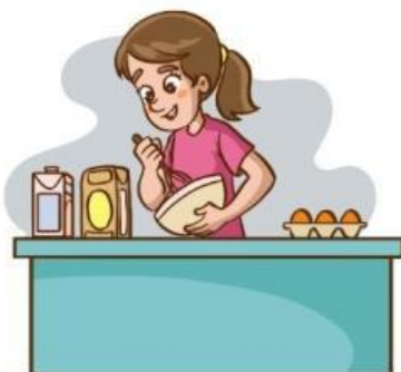
Orang membuat kue

Jawablah soal berikut dengan benar. Selamat Mencoba!