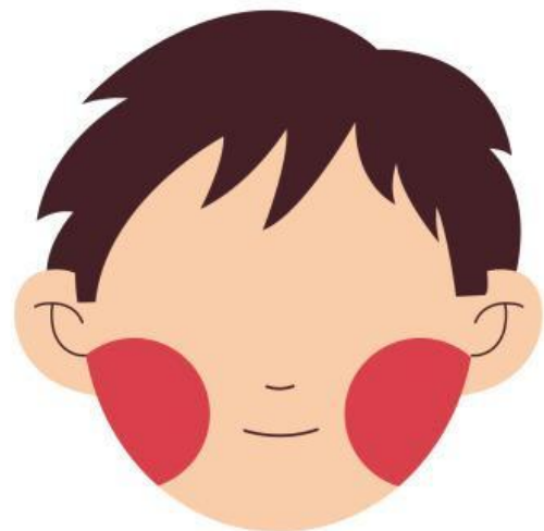
Cheeks (Đôi má)