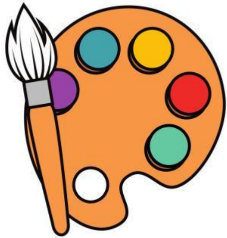
Paint (Màu vẽ)