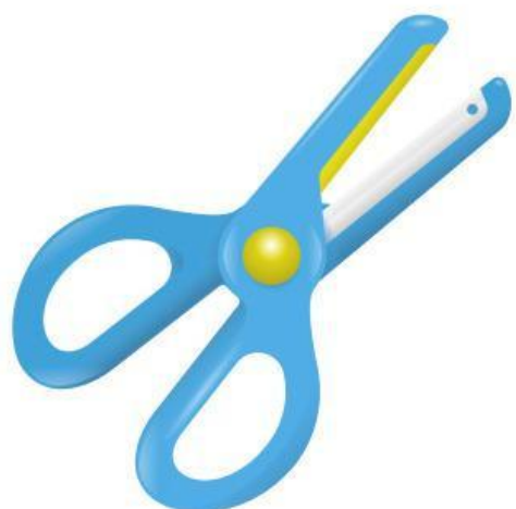
Scissors (Cây kéo)