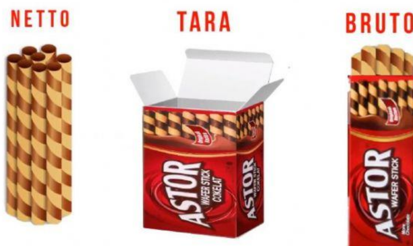
Gambar 2 Ilustrasi Bruto, Netta, dan Tara

Dalam kegiatan pembelajaran kali ini, kalian akan menonton sebuah video atau menelaah gambar ilustrasi untuk mengenal dan menganalisis situasi terkait aritmatika sosial mengenai bruto, netto, dan tara. Jika kalian memiliki akses internet, silahkan kalian simak video yang ada pada link berikut ini : https://www.youtube.com/watch?v=HAKlvdhni4E sebagai acuan untuk menjawab pertanyaan yang tersedia. Bagi kalian yang tidak mempunyai akses internet, silahkan kalian telaah ilustrasi berikut :