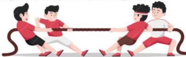
Gambar 1. lomba tarik tambang

Lomba tarik tambang sering dilakukan oleh masyarakat ketika memperingati Hari Ulang Tahun Republik Indonesia. Lomba Tarik tambang adalah permainan tradisional berbentuk adu kekuatan yang dilakukan oleh dua regu dengan jumlah anggota sama. Kedua tim berdiri berhadapan, masing-masing memegang ujung tali tambang yang panjang dan kuat. Di tengah arena biasanya diberi tanda batas (garis).