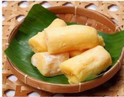
Gambar 2. Tape

Inovasi teknologi biologi terbagi menjadi dua jenis yaitu inovasi teknologi biologi konvensional (tradisional) dan inovasi teknologi modern. Inovasi teknologi biologi konvensional adalah penerapan ilmu biologi yang menggunakan mikroorganisme dari makhluk hidup secara alami, tanpa adanya rekayasa genetik, untuk menghasilkan suatu produk atau jasa (Siti & Jannah, 2022). Adapun contoh dari inovasi teknologi biologi konvensional sebagai berikut.