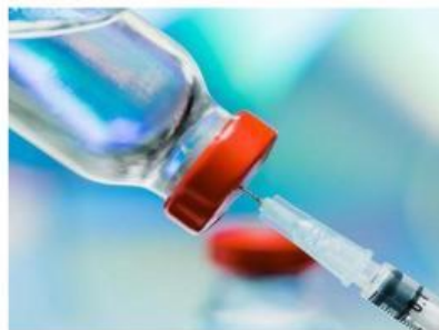
Gambar 3. Obat Vaksin

Inovasi teknologi biologi modern berfokus pada pemanfaatan teknik-teknik canggih dalam rekayasa genetik untuk menghasilkan organisme transgenik dan DNA rekombinan (Sidey et al. , 2024). Adapun contoh dari inovasi teknologi biologi modern sebagai berikut.