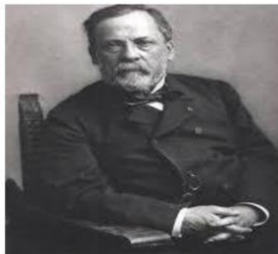
Gambar 1. Louis pasteur

Dometika merupakan contoh awal dari inovasi teknologi biologi yang dilakukan oleh nenek moyang kita pada 10.000 tahun lalu untuk mulai memelihara tumbuhan berupa padi, jelai dan gandum sebagai sumber makanan, selain itu hewan liar seperti anjing, domba dan kambing menjadi salah satu hewan pertama yang dijinakkan untuk menghasilkan susu dan daging, membantu membajak maupun menjaga pertanian. Nenek moyang kita juga menggunakan mikroorganisme dalam mengelola susu menjadi keju dan yoghurt.