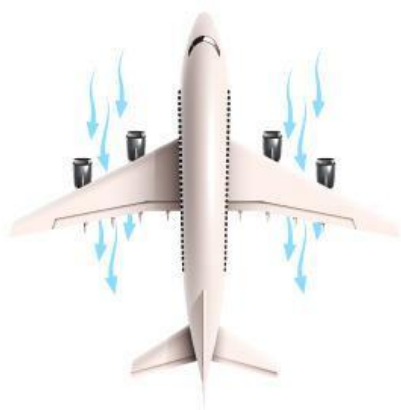
Gambar 3.1 Aliran Udara di Pesawat Terbang

Dalam kehidupan sehari-hari, kita sering melihat air mengalir melalui pipa, selang, atau bahkan sayap pesawat yang terangkat saat melaju di udara. Dua konsep penting yang menjelaskan fenomena tersebut adalah Prinsip Kontinuitas dan Hukum Bernoulli.