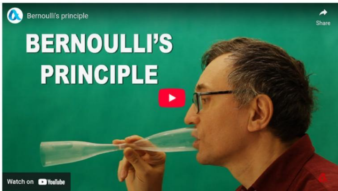
Video 4.1 Prinsip Kontinuitas dan Bernouli

Amati Video tentang tegangan permukaan berikut ini