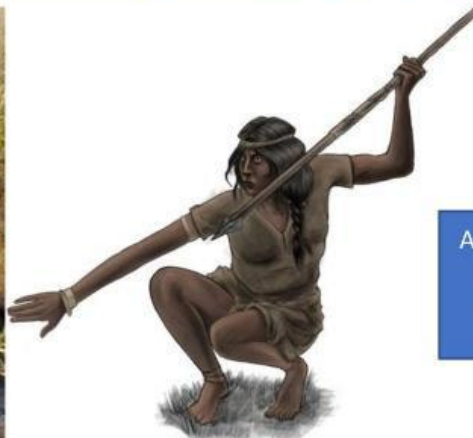
Ayelén( alegría) Prometida de Atuq.