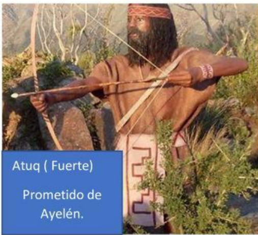
Atuq ( Fuerte) Prometido de Ayelén.