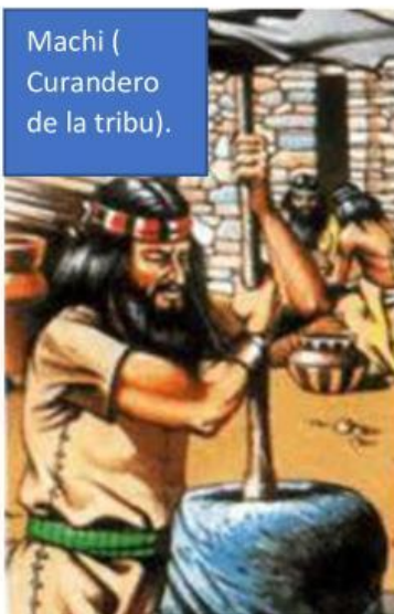
Machi ( Curandero de la tribu).