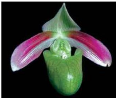
Gambar 1. Paphiopedilum , Jenis Anggrek Dilindungi di Papua

Paphiopedilum violascens adalah _____ jenis anggrek endemik Papua yang tumbuh di hutan hujan dataran rendah hingga pegunungan. Anggrek ini _____ kantung bunga berwarna hijau _____ bintik hitam.