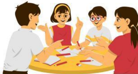
Tugas atau Langkah- langkah Kerja