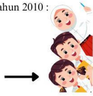
Kompetensi Dasar (KD) / Indikator / Materi Pokok