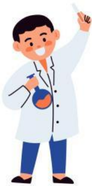
Informasi Pendukung (Materi Singkat)