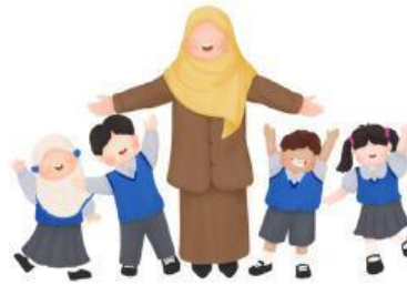
Petunjuk Belajar (Petunjuk Penggunaan)