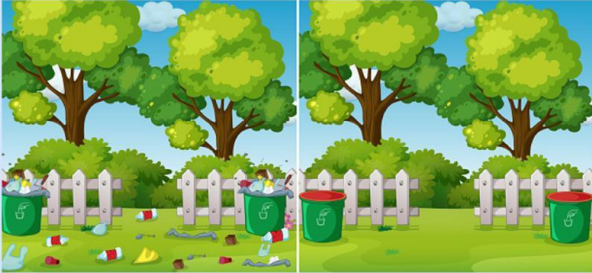
Gambar lingkungan kotor