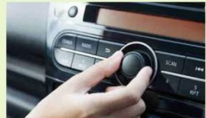
Kegiatan 3. Menyalakan radio mobil