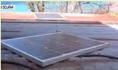
Kegiatan 1. Meletakkan alat bantu penerangan dibawah sinar matahari