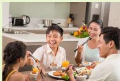
Kegiatan 7. Menikmati makanan