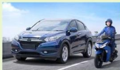
Kegiatan 2. Mengendarai alat transportasi