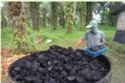
Kegiatan 4. Mengambil arang