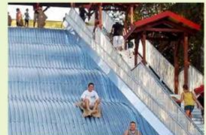
Kegiatan 6. Naik dan menuruni perosotan