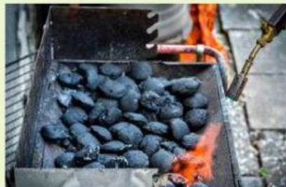
Kegiatan 5. Menyiapkan pemanggangan dengan bantuan api