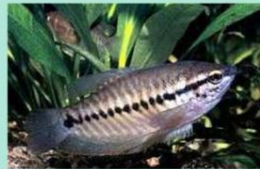
Ikan Sepat Siam