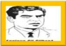
Enrique Gil Gilbert