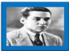
José de La Cuadra