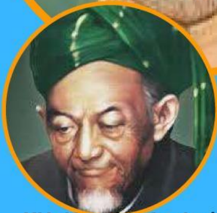
KH. Hasyim Asy'ari