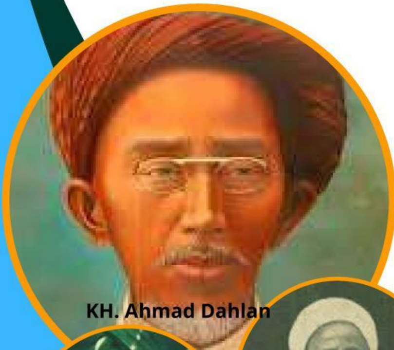
KH. Ahmad Dahlan