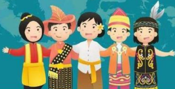
Gambar 3. Keberagaman kebudayaan