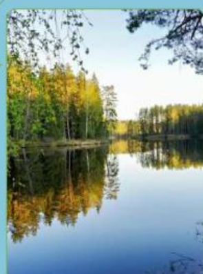
Gambar 2. Lingkungan tidak tercemar