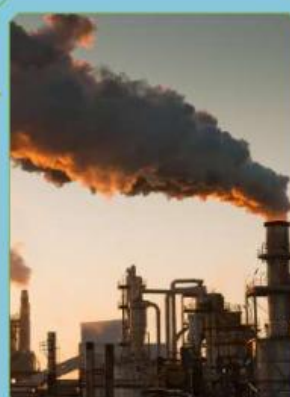
Gambar 3. Udara dengan jejak karbon dan pemanasan global