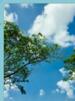
Gambar 3. Udara tanpa jejak karbon dan pemanasan global