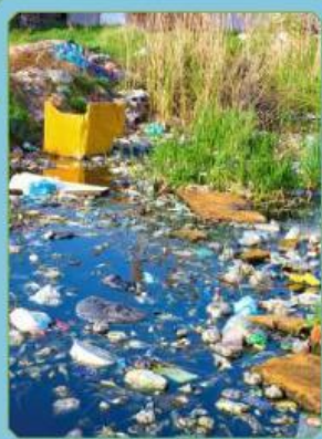
Gambar 1. lingkungan tercemar