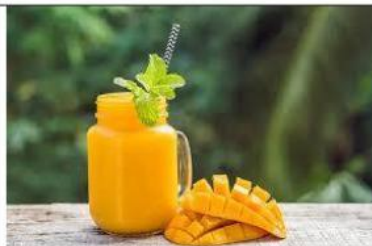
Gambar 1 . Jus Mangga

Lengkapi teks prosedurmu dengan memberi judul , tujuan alat dan bahan , serta langkah kerja !