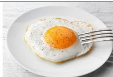
Gambar 2. Telur Ceplok