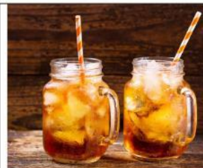
Gambar 3. Es Teh Manis