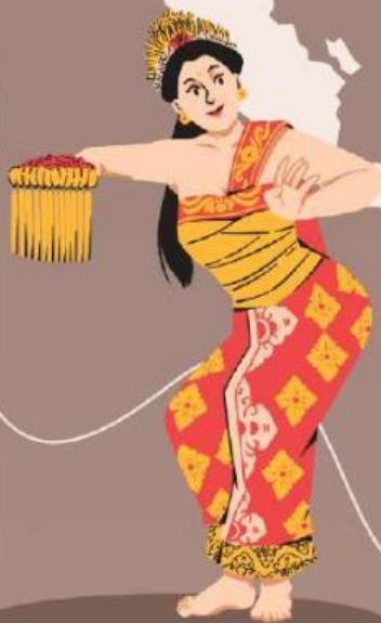
• Tari Pendet Bali