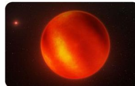
BINTANG LUHMAN 16

Bintang tersebut kemudian diberi nama Luhman 16, sebagai penghormatan kepada astronom Kevin Luhman yang banyak berjasa dalam studi bintang-bintang kecil dan redup.