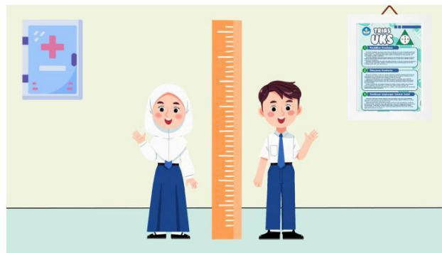
Ilustrasi Pengukuran Tinggi Badan Siswa

Menjaga kesehatan tidak hanya dilakukan dengan rutin berolahraga, tetapi juga dengan memperhatikan pertumbuhan dan perkembangan tubuh, terutama pada masa remaja. Salah satu indikator penting dalam perkembangan fisik adalah tinggi badan. Tinggi badan yang ideal menjadi gambaran umum dari pertumbuhan yang sehat serta perkembangan fisik yang sesuai dengan usia.