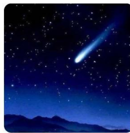
BINTANG - BINTANG DI ANGKASA

Pernahkah kamu menatap langit malam dan melihat kelip-kelip bintang yang tersebar luas? Bintang sebenarnya adalah sebuah bola gas dengan hidrogen dan helium, sehingga membuat ia mampu bersinar terang dan memancarkan cahayanya sendiri.