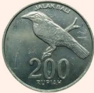
Gambar 1. Koin

Perhatikan gambar koin dan dadu dibawah ini!