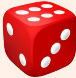
Gambar 2. Dadu

Jika sebuah koin dan sebuah dadu dilempar secara bersama-sama, tentukan: