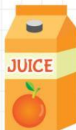
你早饭喝什么？我喝...