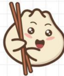
很多人春节吃这个