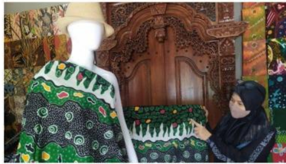
Gambar 1. 1 UMKM Batik Selotigo di Kota Salatiga

UMKM Batik Selotigo di Kecamatan Sidorejo, Kota Salatiga merupakan salah satu pelaku industri kreatif yang menggabungkan kearifan lokal dengan inovasi digital. Dalam menghadapi permintaan pasar yang semakin luas terutama melalui pemesanan online dan marketplace UMKM ini mengembangkan sistem otomatisasi produksi berbasis digital.