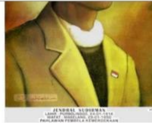
JENDRAL SUDIRMAN Lahir : Purbalingga, 24-01-1916 Wafat : Mangrove, 25-01-1990 Pahlawan Pemuda Kemerdekaan

Lahir di Bonjol, Sumatera Barat pada tahun 1772.