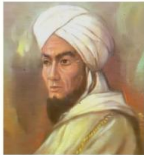
TUANKU IMAM BONJOL Lahir : Tanjung Bunga, (Pasaman) Sumatra Barat 1772 Wafat : Lotak Menado 8 — 11 — 1864

Dia adalah sosok yang lahir dikampung tanjung bunga dan seorang ulama dan pemimpin masyarakat, dirinya berjuang bersama kaum paderi pada tahun 1803-1838.