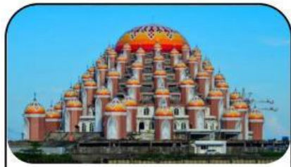
Masjid 99 Kubah