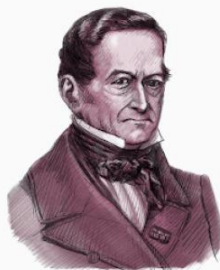
Gottfried Achenwall

Gottfried Achenwall lahir di Elbing, Provinsi Royal Prusia, Polandia pada tanggal 20 Oktober 1719. Ia kuliah di Universitas Leipzig dan mendapatkan gelar Master pada tahun 1746 pada Fakultas Filsafat Universitas Leipzig.