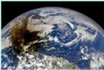
Sepertiga Spesies di Bumi Terancam Punah Gara-gara Efek Rumah Kaca

Efek rumah kaca akan berimbas pada punahnya sepertiga spesies makhluk di bumi