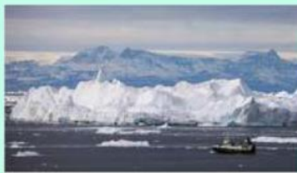
Kiamat Es Makin Dekat, Waspada Cuaca Ekstrem!

Perubahan cuaca yang semakin ekstrem menjadi musuh utama dunia saat ini akibat pemanasan global