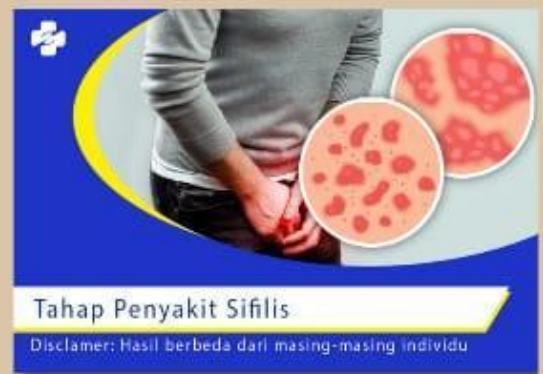
Gambar 1. Penyakit Sifilis