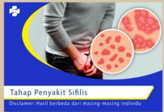
Gambar 1. Penyakit Sifilis