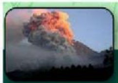
Abu vulkanik dari letusan gunung berapi