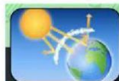
Efek Rumah Kaca