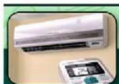
Penggunaan Produk Pendingin Ruangan