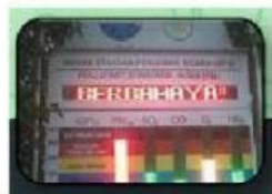
Penurunan Kualitas Udara

B. Tarik garis pada penyebab dan dampak dari pencemaran udara