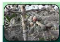
Terganggunya pertumbuhan tanaman