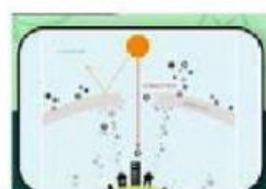
Rusaknya Lapisan Ozon