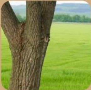
Batang berfungsi sebagai .....