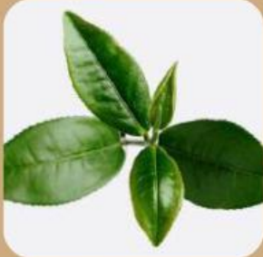
Daun berfungsi sebagai .....