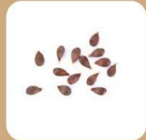
Biji berfungsi sebagai .....