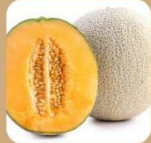
Buah berfungsi sebagai .....