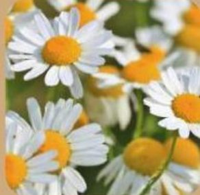
Bunga berfungsi sebagai .....