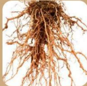
Akar berfungsi sebagai .....