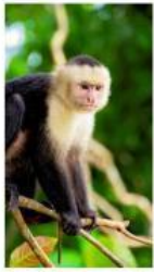
Ex : Le singe

Activité 1 : Écris le nom de chaque animal sous sa photo, comme dans l'exemple.