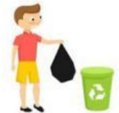
to throw out the trash