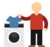
to wash the clothes