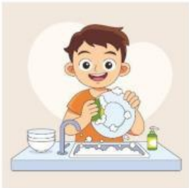
to wash the dishes