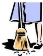
to sweep the floor