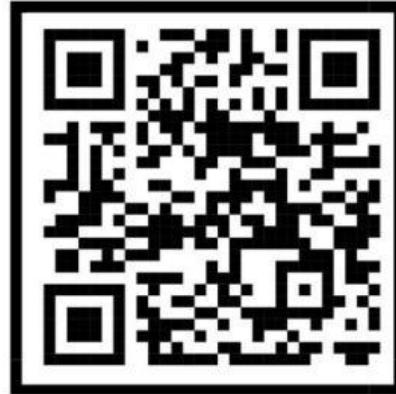
Kelompok 2 : Leukimia