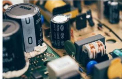
Gambar 4. kapasitor

Komponen elektronika adalah elemen dasar yang membentuk rangkaian elektronika dan memungkinkannya berfungsi sebagaimana mestinya. Komponen-komponen ini dapat menempel langsung pada papan rangkaian atau terhubung melalui kabel. Setiap komponen memiliki fungsi tersendiri dalam rangkaian, seperti mengatur arus dan tegangan, menyearahkan arus, atau memperkuat sinyal.