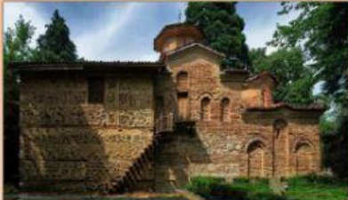
а) Боянската църква, София

Въздигна се от земята и се съгради този пречист храм на светия йерарх Христов Никола... със залягането, труда и голямата любов на севастократор Калоян, братовчед царев... Написа се пък при Българското царство, при благоверния и благочестив и христоролюбив цар Константин Асен.