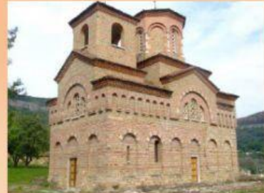
в) Църквата „Свети Димитър“, В. Търново