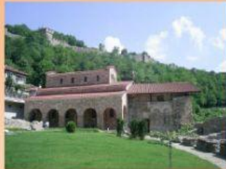
б) Църквата "Свети 40 мъченици" В. Търново