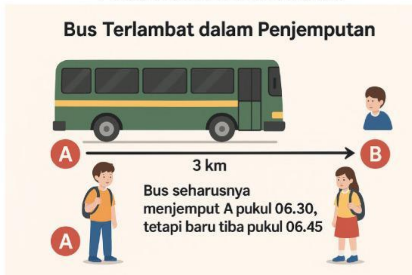
Gambar 1.1. Penjemputan siswa dengan bus ke sekolah