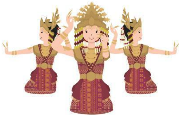
Tari Gending Sriwijaya