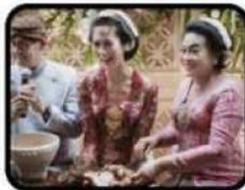
Midodareni di Jawa