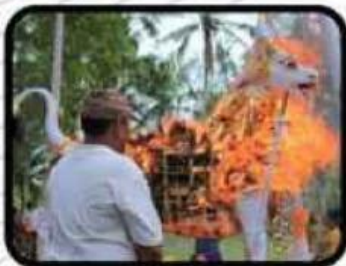
Ngaben di Bali